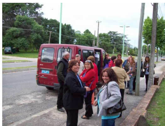
De Canelones, venían llegando