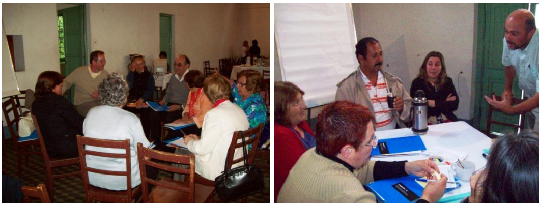
Articular para fortalecer. Compartir experiencias, un buen comienzo

Por otro lado se pusieron de manifiesto dificultades para el gerenciamiento de las organizaciones. Se demandaron capacitaciones en esa temática, así como en técnicas de elaboración de proyectos para la obtención de recursos y financiamiento.