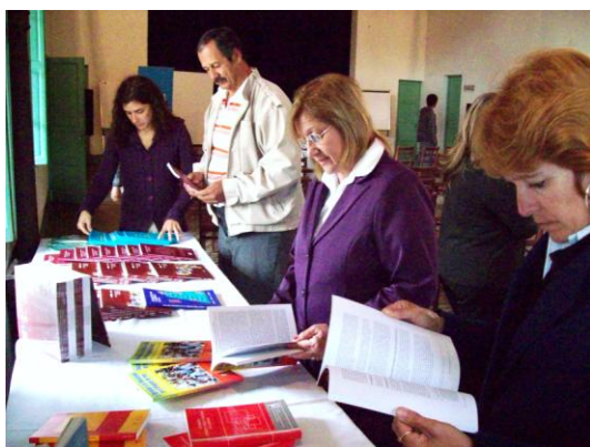
La expectativa era grande

En función de ello, el trabajo giró en torno al rol de las OSC de la región, y la identificación de sus debilidades y fortalezas tanto para llevar adelante su misión, como para participar de manera efectiva e incidir en la definición e implementación de las políticas locales, ya sea individualmente o a través del trabajo en redes.