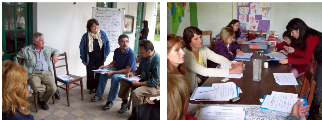
El trabajo en grupos. Fue en sí una experiencia de fortalecimiento

Respecto a los recursos para el trabajo de las organizaciones, el grupo planteó que la mayor dificultad está asociada a cómo acceder a los mismos (conocimiento de la Cooperación y otros fondos disponibles, elaboración de proyectos) y no tanto a su oferta; por lo cual este componente fue ubicado en un punto medio entre las fortalezas y las debilidades.