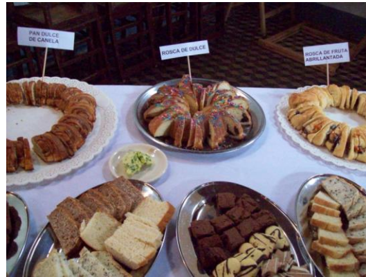
La agricultura familiar, una experiencia compartida durante el Foro