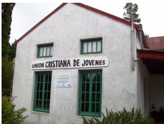
Los momentos previos al inicio

El trabajo se enmarca en el producto o componente 3 del Proyecto que se viene materializando a través de la acción conjunta entre las organizaciones locales y las redes implementadoras del mismo (Comité de los Derechos del Niño, Mundo Afro, la Comisión Nacional de Seguimiento- Mujeres por democracia, equidad y ciudadanía, la Plataforma Interamericana de Derechos Humanos, Democracia y Desarrollo, la Red de ONGs Ambientalistas y la Asociación Nacional de Micro y Pequeñas Empresas- AMNYPE). Se busca así es el fortalecimiento del diálogo inter-redes y la ubicación de puntos focales que se constituyan en referentes para una futura articulación y acción de fortalecimiento en cada región.