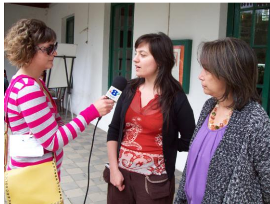
La prensa local cubrió el encuentro