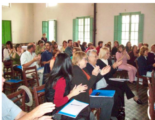
El entusiasmo también

Como se describe más adelante, la metodología del encuentro supuso la combinación de paneles y trabajos en grupos, lo cual habilitó el intercambio de experiencias.