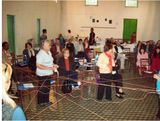
El desafío de tender redes